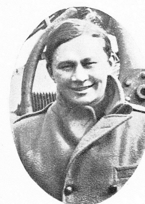
de MAELCAMP D'OPSTAELE, Léon, né le 13 août 1896, à Bruxelles. 1 er Sergent-pilote. Ordre de Léopold; Croix de Guerre. Trouva la mort le 22 août 1917, aux "Moères belges", près de La Panne, au cours d'un vol d'essai, en service commandé.