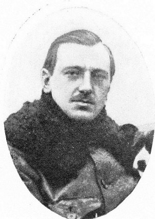
de MONTIGNY, Charles-Alb., né le 4 juin 1892, à Anvers. Adj., 10 e Escadrille de chasse, O. L.; O. C.; C. G. Engagé volontaire dès le début des hostilités, fut gravement blessé au nord de Roulers, le 15 oct. 1918, au cours d'un violent combat aérien avec des Fokkers. Il succomba à ses blessures, à Calais, le 30 du même mois.